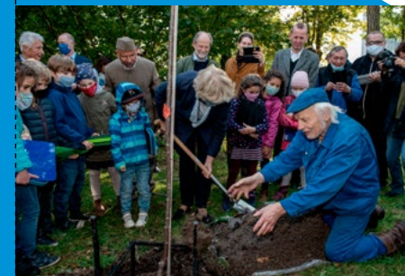
Ben Wagin und Monika Grütters mit Schülerinnen und Schülern beim Pflanzen eines Kirschbaums, 2021

Neben der inhaltlichen Konzentration auf die Geschichte von Mauer und Teilung wird im Parlament der Bäume auch der Tod zahlloser sowjetischer Soldaten am Ende des Zweiten Weltkriegs thematisiert. Sie wurden im Kampf zur Erstürmung des Reichstages von einer bis dahin unentdeckten SS-Einheit erschossen.