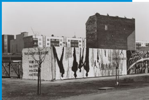
Das Parlament der Bäume 1992

Im Jahr 1990 erschuf der Künstler Ben Wagin das Parlament der Bäume, indem er den ehemaligen Grenzstreifen der Berliner Mauer gegenüber dem Reichstag zu bepflanzen begann. Der Ort wurde zum Mahnmal gegen Krieg und Gewalt und erinnert inmitten des Berliner Regierungsviertels an die Todesopfer an der Berliner Mauer.