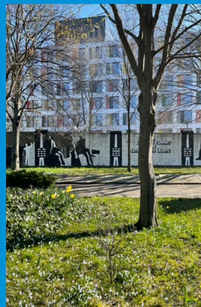
Frühling im Parlament der Bäume, 2022