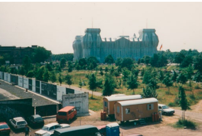
Das Parlament der Bäume und der verhüllte Reichstag, 1995