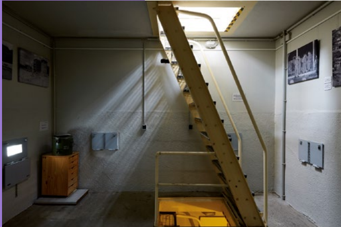
Der Turm von innen, 2019

Die Gedenkstätte am Kieler Eck befindet sich in einer ehemaligen Führungsstelle der DDR-Grenztruppen am Berlin-Spandauer Schifffahrtskanal (heute Berlin-Mitte). Nach dem Mauerfall wurde sie zu einem Erinnerungsort für eines der ersten Todesopfer an der Berliner Mauer: Günter Litfin. Sie ist gleichzeitig ein Dokument des Grenzregimes und ein Zeugnis für seine Opfer.