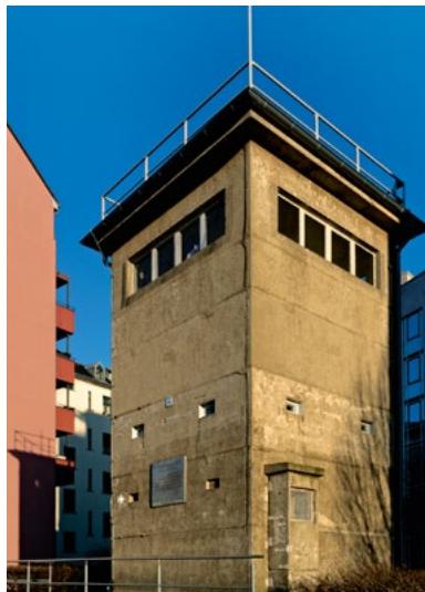
Gedenkstätte Günter Litfin, 2018