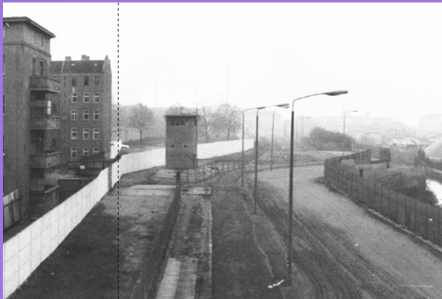
Der Führungsturm am Kieler Eck im Grenzstreifen, 1988

Günters Bruder, Jürgen Litfin, setzte sich nach dem Mauerfall für den Erhalt der ehemaligen Führungsstelle ein. Durch dieses bürgerschaftliche Engagement blieb der Wachturm trotz umgebender Neubebauung erhalten. Am 24. August 2003 eröffnete Jürgen Litfin hier einen Erinnerungsort an die Berliner Mauer und ihr erstes durch Schüsse zu Tode gekommenes Opfer. Der von ihm gegründete Verein betreute die Gedenkstätte, bis sie 2017 in die Obhut der Stiftung Berliner Mauer kam.