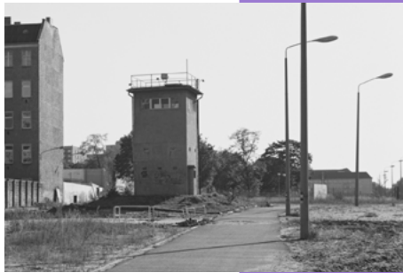
Ehemalige Führungsstelle am Kieler Eck, 1990

1962 wurde an der Sandkrugbrücke auf West-Berliner Seite ein Gedenkstein eingeweiht. Im Jahr 2015 fand die feierliche Versetzung des Steines an den Ort statt, an dem Günter Litfin erschossen wurde.