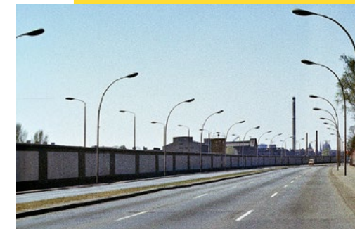
Mühlenstraße 1987