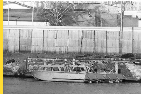
Patrouillenboot der Grenztruppen auf der Spree, 1980

Neben der topographischen Besonderheit weist die Grenzanlage hier auch eine bauliche Seltenheit auf: Anders als an den meisten anderen Orten war die östliche Seite der Mauer für jedermann sichtbar, diente die Mühlenstraße doch als „Protokollstrecke“ für hochrangigen Besuch in der DDR. Daher wurde die Hinterlandmauer hier als die bekannte „Grenzmauer 75“ ausgeführt, die andernorts fast immer nach West-Berlin zeigte. Die 3,6 Meter hohen Mauerteile sollten den Blick auf den Todesstreifen versperren.