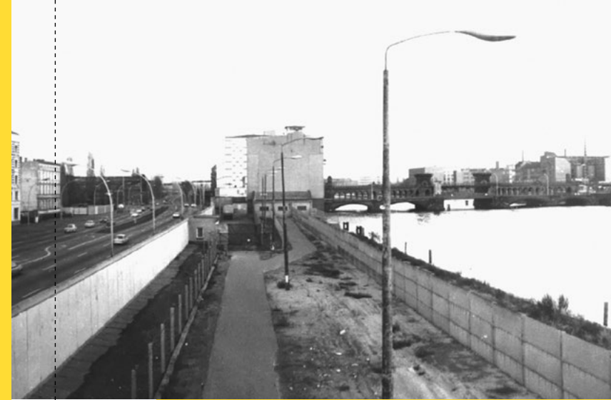
Grenzanlage an der Mühlenstraße, Blick nach Südosten, 1988