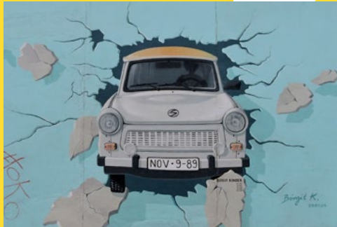
Birgit Kinder, Test the Rest , 2019

Das längste noch erhaltene Teilstück der Berliner Mauer zwischen Ostbahnhof und Oberbaumbrücke ist als East Side Gallery weltberühmt geworden. 118 Künstlerinnen und Künstler aus 21 Ländern gestalteten nach dem Mauerfall auf 1,3 Kilometern des früheren Grenzelements die längste Open-Air-Gallery der Welt. Als Symbol der Freude über die Überwindung der deutschen Teilung und zugleich als historisches Zeugnis des unmenschlichen DDR-Grenzregimes ist die East Side Gallery heute einer der meistbesuchten touristischen Orte der Hauptstadt.