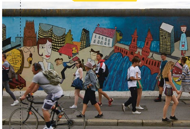
Jim Avignon, Doin' it cool for the East Side , 2018