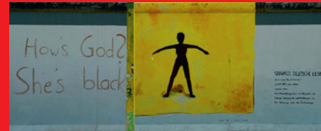
Christine Fuchs She's black