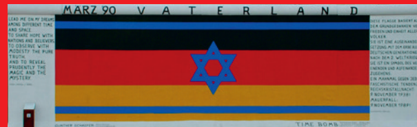
Günther Schaefer Vaterland