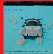
Birgit Kinder Test the Rest