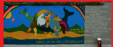
Ursula Wünsch Frieden für Alles