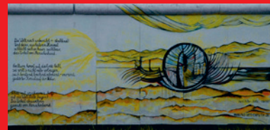
Siegrid Müller-Holtz Gemischte Gefühle