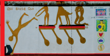
Kiddy Citny Qui baise qui