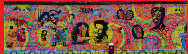
Herve Morlay (VR2009*) Amour, Paix-Sagesse